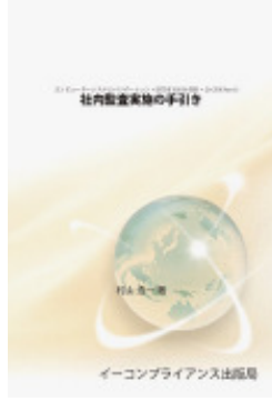
社内監査の手引き