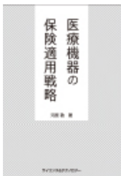
医療機器の保険適用戦略