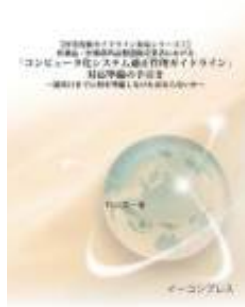
コンピュータ化システム適正管理ガイドライン対応準備の手引き