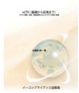
eCTD (基礎から応用まで)