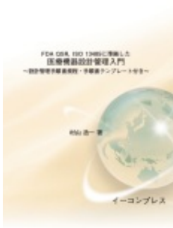
医療機器設計管理入門