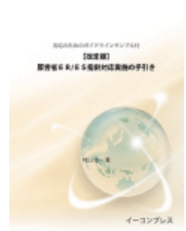
【改定版】厚労省E R / E S指针对応実施の手引き