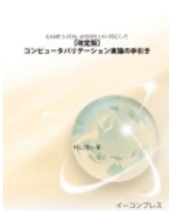
コンピュータバリデーション実施の手引き