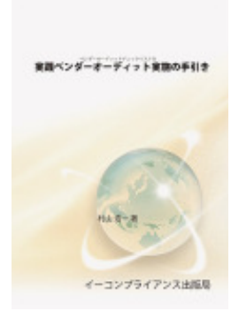
実践ベンダーオーディット実施の手引き