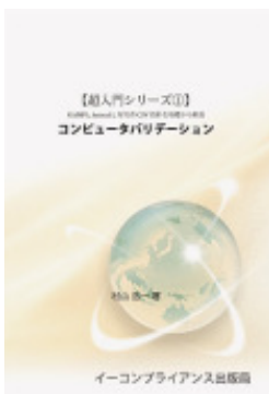
【超入門シリーズ1】コンピュータバリデーション